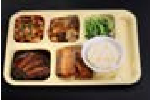
Assortiment repas chinois