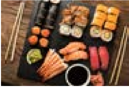
Plateau de sushi : sushi rolls et sashimi

Photos utilisables pour créer les fiches « produits ».