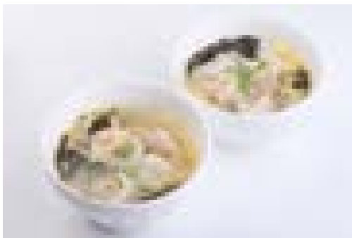
Soupe de raviolis