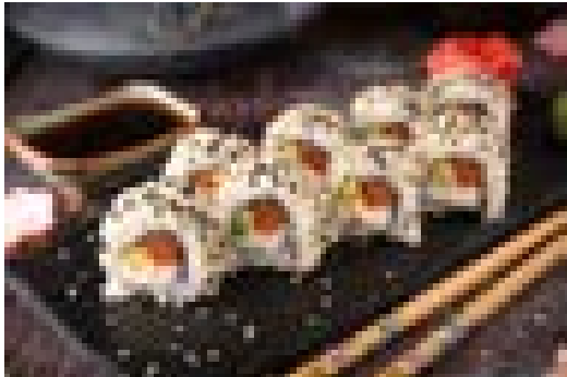
Roll avec saumon, avocat, concombre