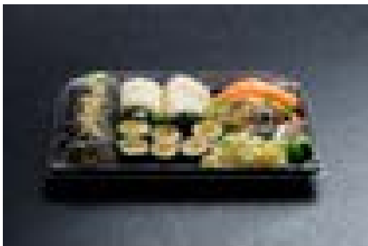
Plateau repas de Sushis