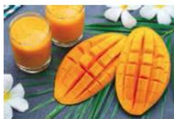
Jus de mangue Prix au litre : 7 euros - Boutelle de 1 litre

roduits régionaux pour boutique en ligne :