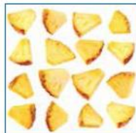
Ananas deshydraté 5 euros les 200 grammes Sachet de 200 grammes