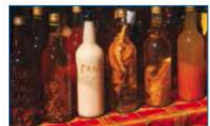
1 bouteille de rhum au choix 15 euros la bouteille de 1 litre